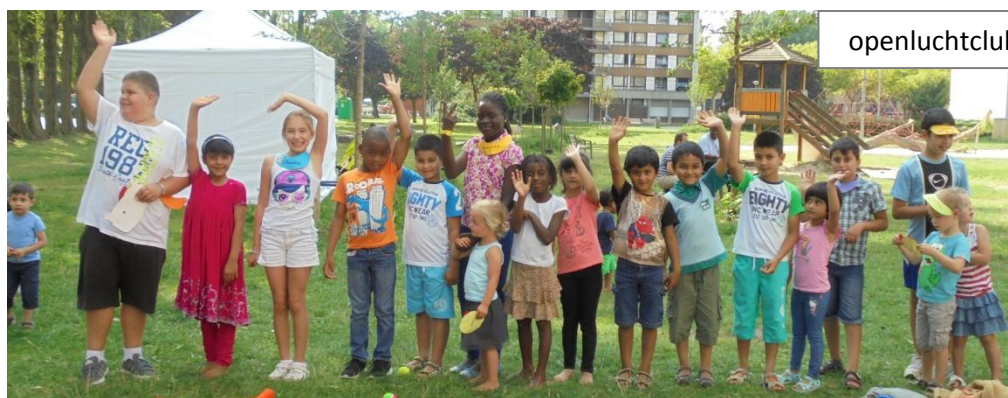
openluchtclub Antwerpen 2015

Zo de Heer wil en wij leven houden we 3, 4 en 5 augustus de openluchtclub in Antwerpen.