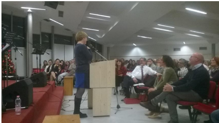
Afscheid nemen van de gemeente in Tirana ← Truck vanuit Albanië met onze huisraad